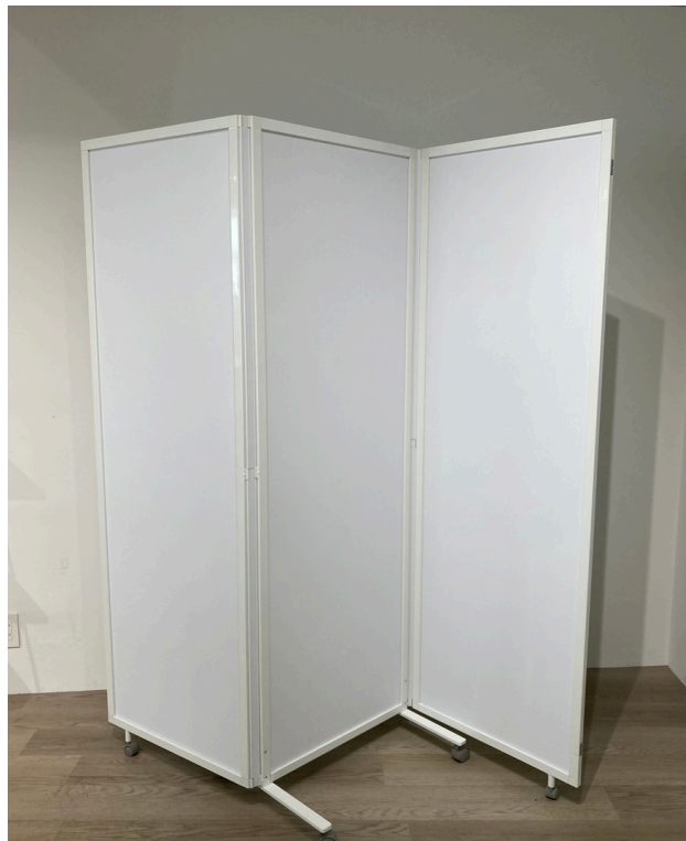
種別：パーティション 個数：1