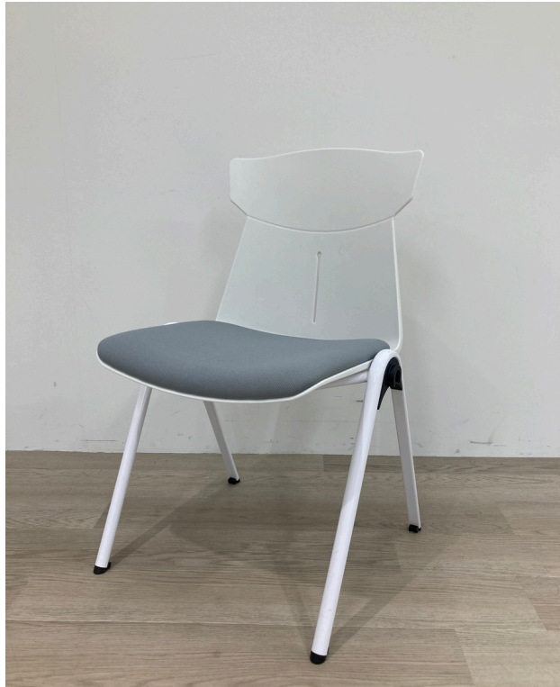
種別：スタッキングチェア 個数：30