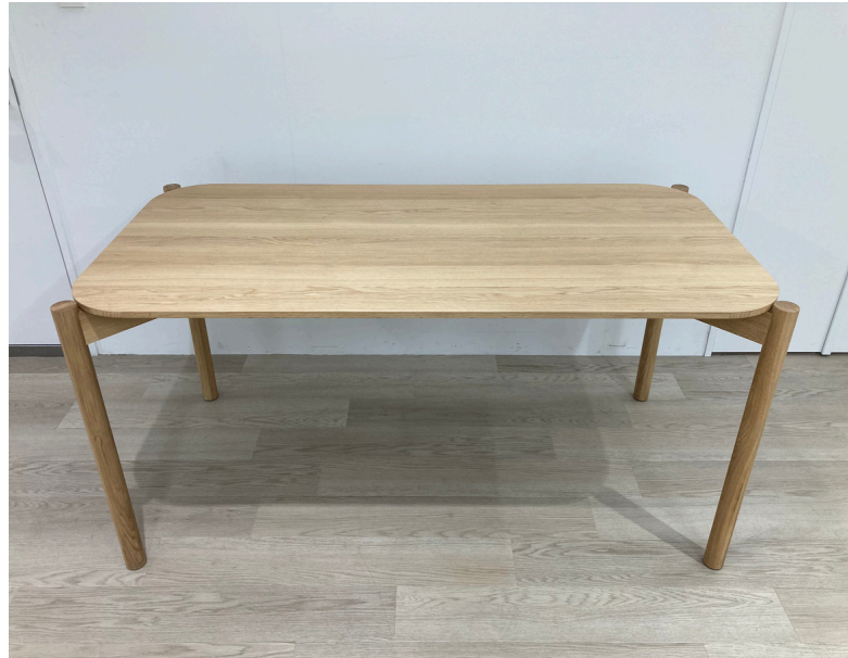
種別：ウッドテーブル 個数：1 詳細：幅1500×奥行750×高さ750