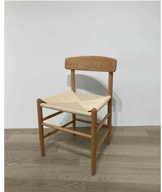
種別：チェア（ブラウン） 個数：4