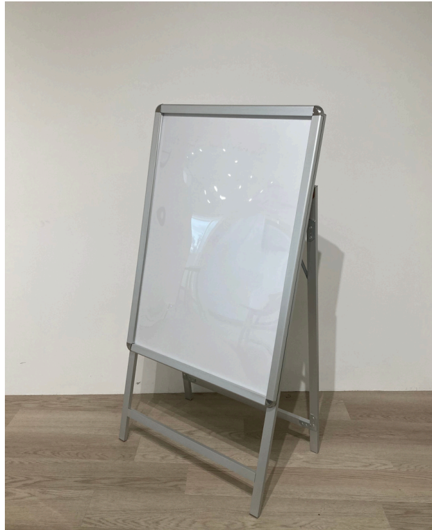
種別：A型看板 個数：1 詳細：A1用紙用