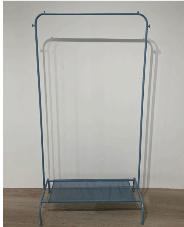
種別：ハンガーラック（青） 個数：2