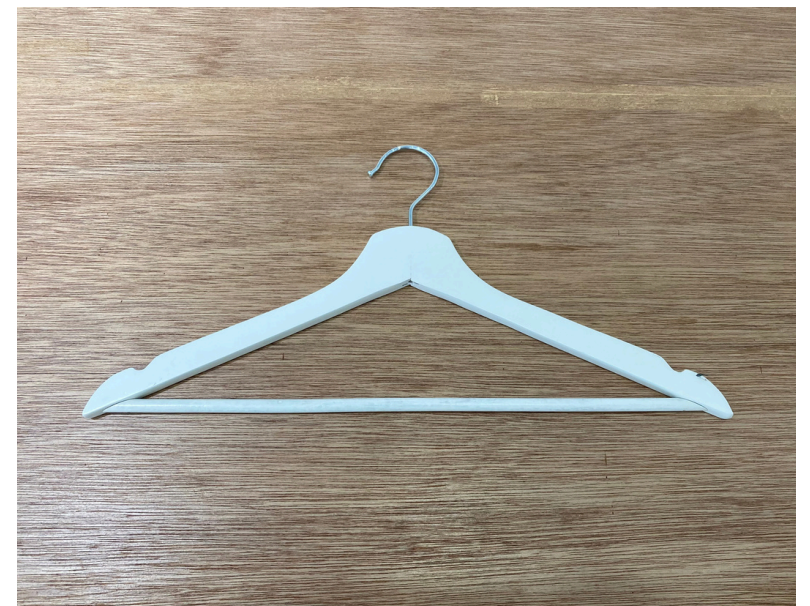
種別：ハンガー 個数：24

※シェルフに配置しているオブジェや雑貨はイメージのため、実際とは異なる場合がございます。