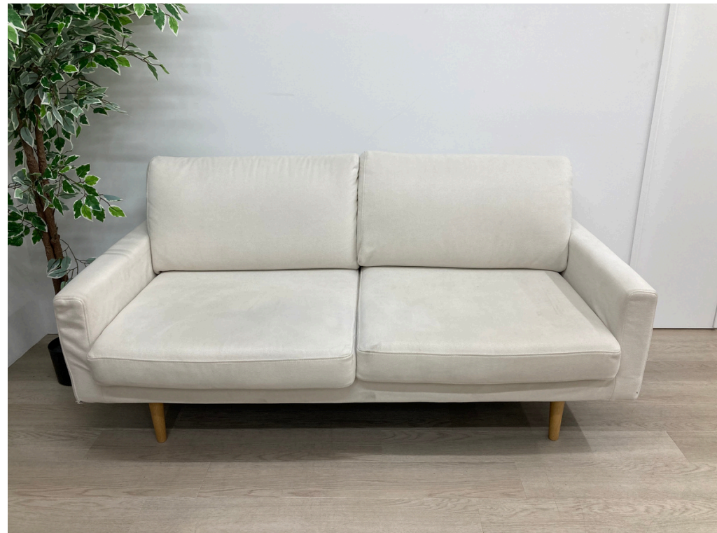
種別：ラウンジソファ 個数：1