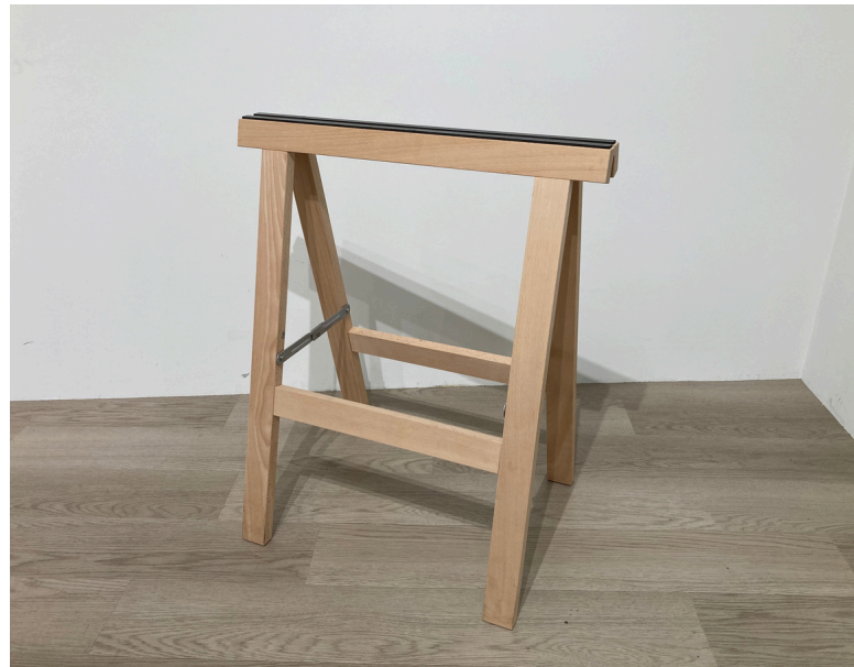
種別：ソーホース 個数：2 詳細：高さ700