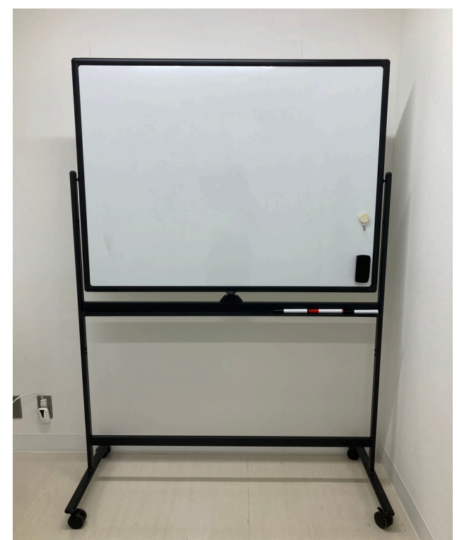
種別：ホワイトボード 個数：1