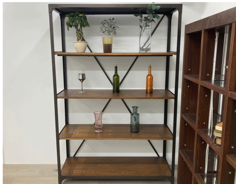
種別：シェルフ（B） 個数：1 詳細：横1200×奥行420×高さ1800

※シェルフに配置しているオブジェや雑貨はイメージのため、実際とは異なる場合がございます。