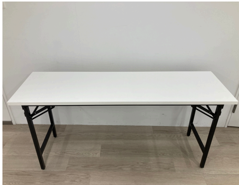
種別：ミーティングテーブル 個数：18 詳細：幅1500×奥行450×高さ700