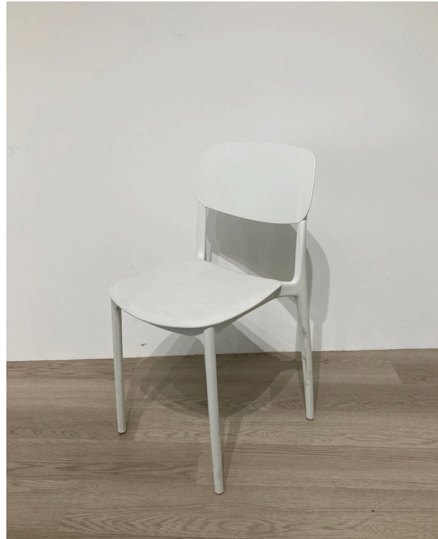
種別：チェア（白） 個数：4