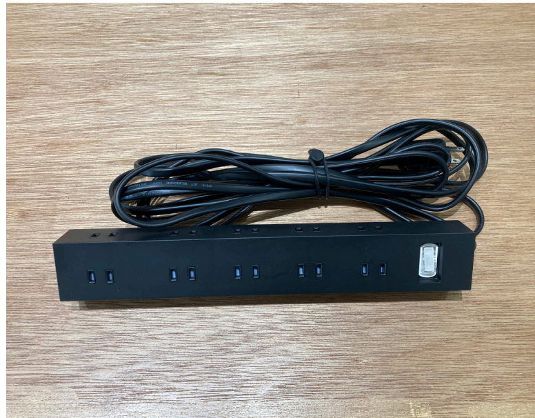
種別：延長コード 個数：6