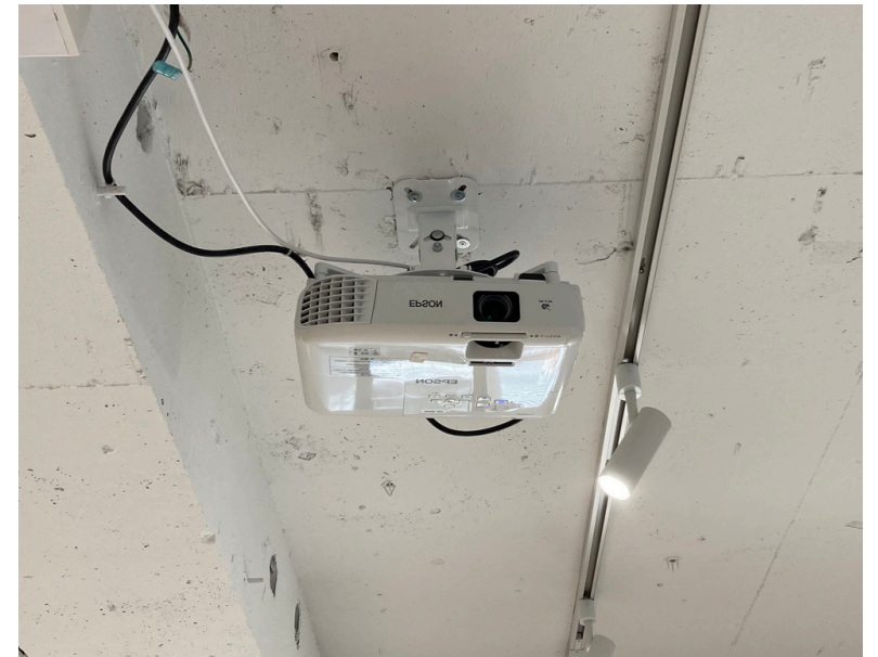
種別：プロジェクター 個数：1 詳細：壁投影 ＜要事前予約＞¥2,200（税込） / 1日