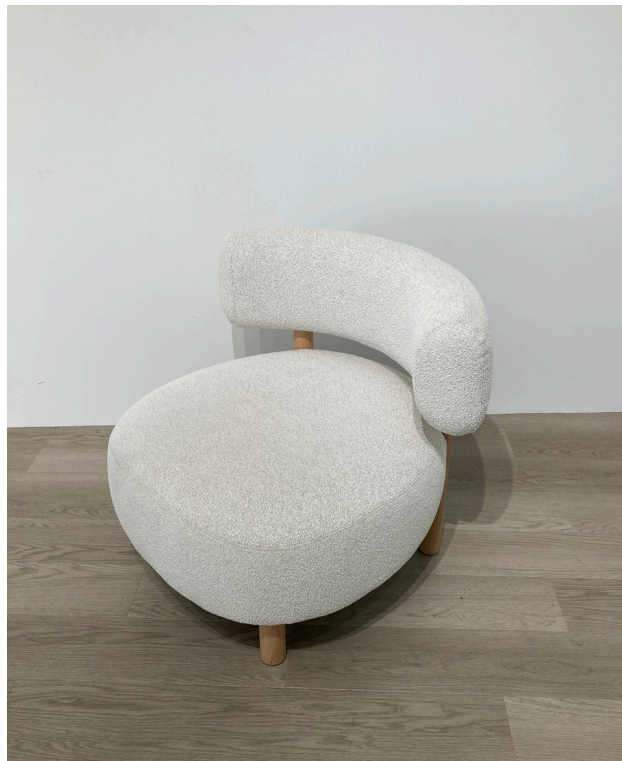
種別：ラウンジチェア 個数：1