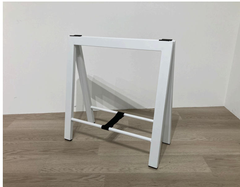
種別：ソーホース 個数：2 詳細：高さ690