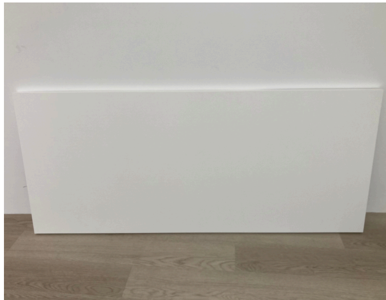
種別：ホワイト天板 個数：2 詳細：横1400×縦600