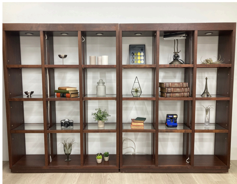
種別：シェルフ（A） 個数：2 詳細：横1600×奥行330×高さ1800 ※写真はシェルフ（A）を2つ使用しています。