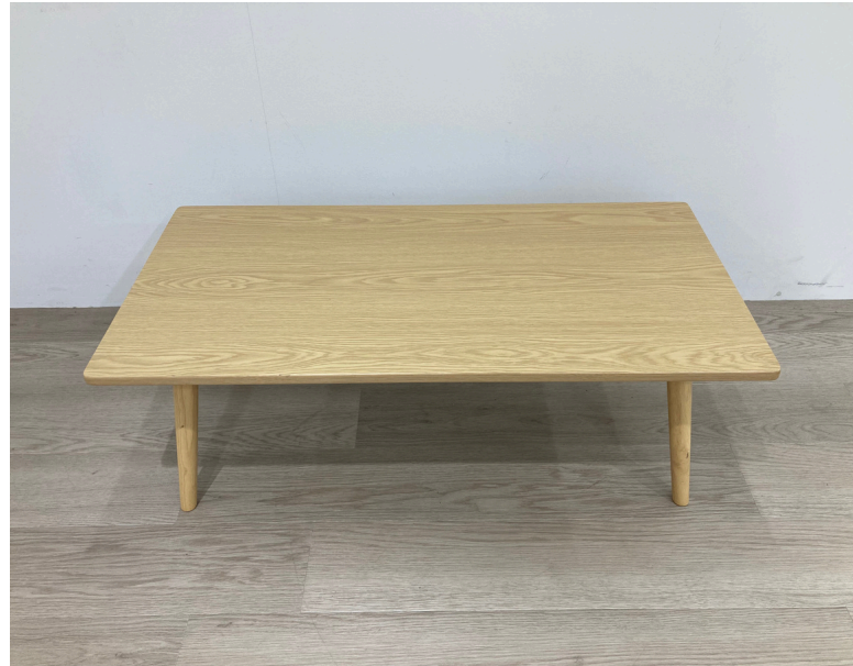
種別：ウッドローテーブル 個数：1 詳細：幅900×奥行450×高さ320