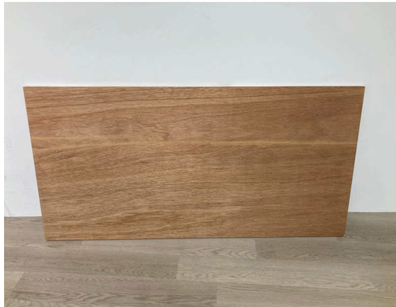
種別：合板天板 個数：2 詳細：横1600×縦800