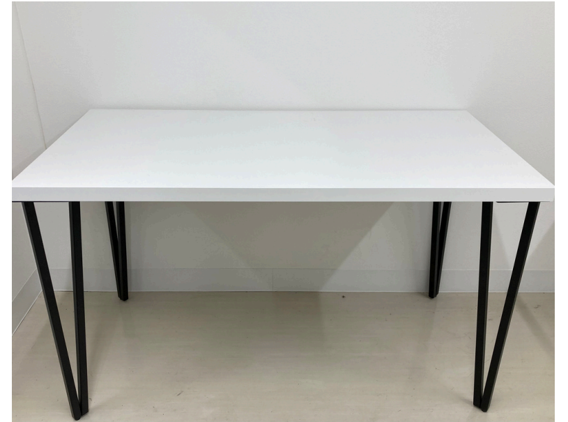
種別：メイクルームテーブル 個数：4 詳細：幅1200×奥行600×高さ700