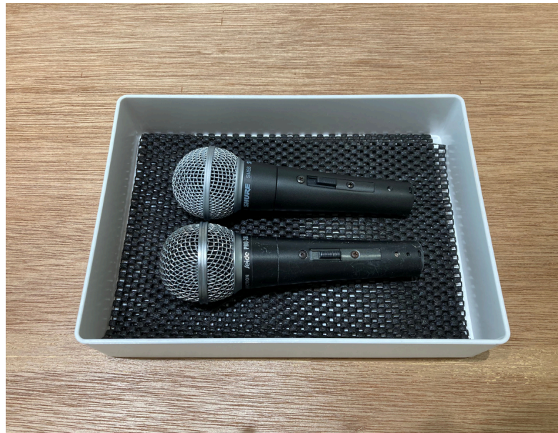
種別：マイクセット 個数：2 詳細：有線マイク ＜要事前予約＞¥2,200（税込） / 1日