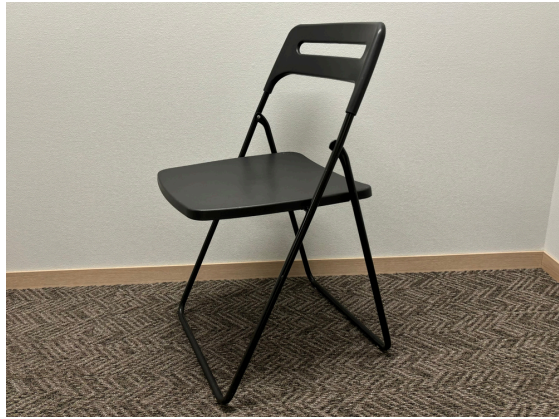
種別：折りたたみチェア 個数：8