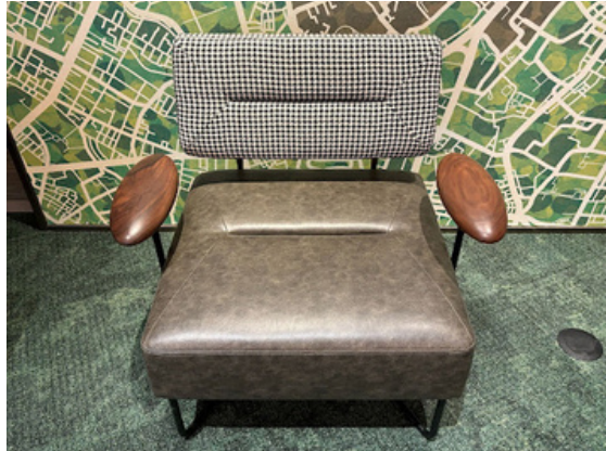
種別：ソファ(c) 個数：2（移動：可） 詳細：W580mm x D500mm × H700