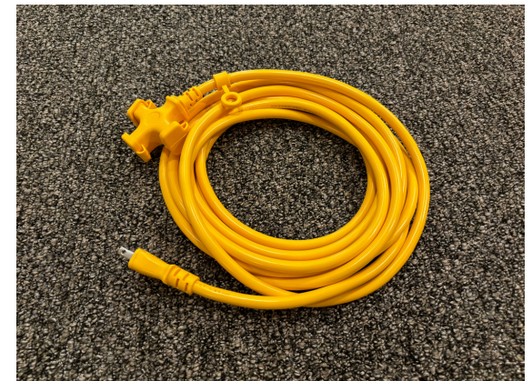
種別：延長コード 個数：2