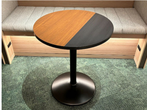
種別：丸テーブル(a) 個数：3（移動：可） 詳細：Φ600 x H710