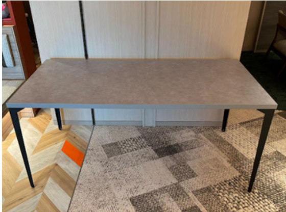
種別：大テーブル 個数：6（移動：可、作業時は2人以上） 詳細：W1,600 x D800 x H710