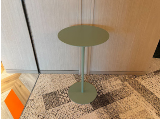
種別：丸テーブル 個数：17（移動：可） 詳細：Φ380 x H650