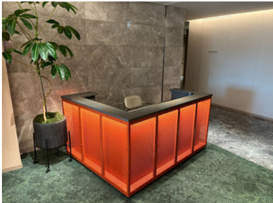
種別：受付カウンター 個数：1（移動：不可） 詳細：W1,730 x D1,380 x H900