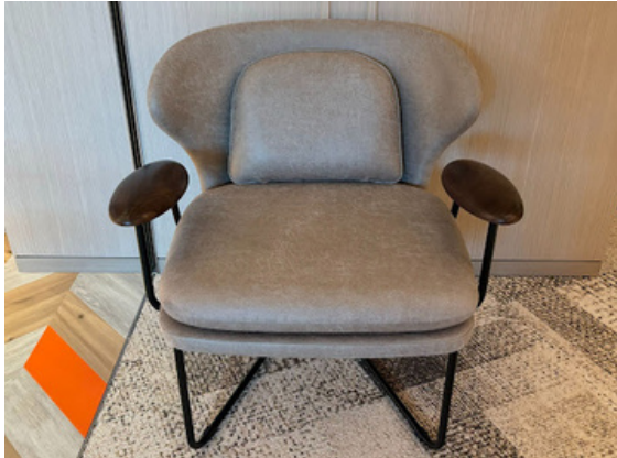
種別：ソファ(b) 個数：2（移動：可） 詳細：W580 x D500 × H730