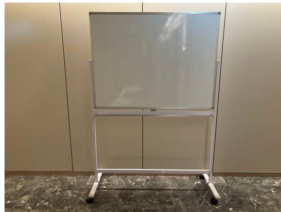
種別：ホワイトボード 個数：1 詳細：W1200