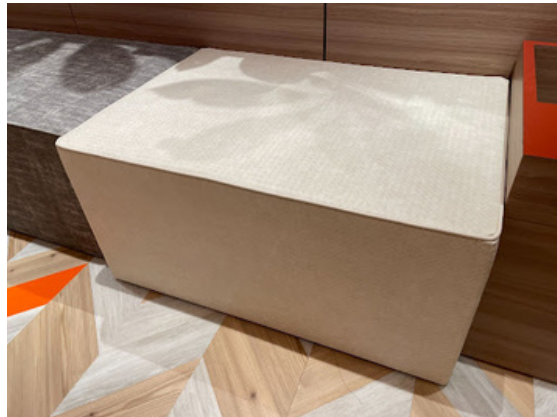
種別：長方形ソファ(b) 個数：2（移動：可、2人以上）