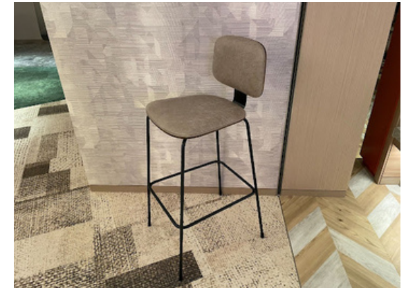
種別：チェア(b) 個数：8 詳細：W370 x D400 x H1,000