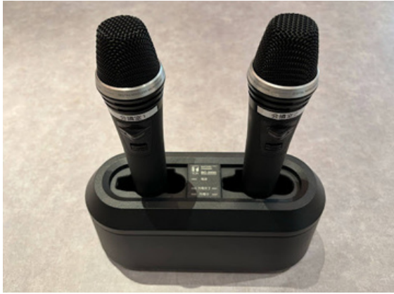
種別：無線マイク 個数：2 詳細：800MHz帯