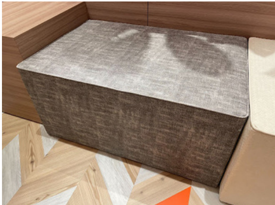
種別：長方形ソファ(a) 個数：2（移動：可、2人以上）