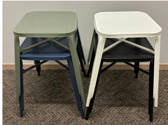
種別：スツール(a) 個数：4