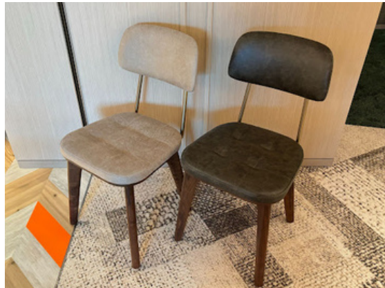
種別：チェア 個数：12（白・グレー各6ずつ） 詳細：W410 x D390 x H800