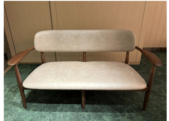
種別：ソファ(a) 個数：2（移動：可、作業時は2人以上） 詳細：W1250 x D580 x H760