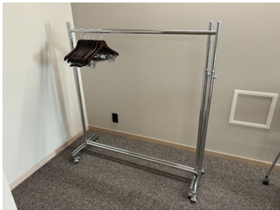
種別：ハンガーラック×2、ハンガー×40