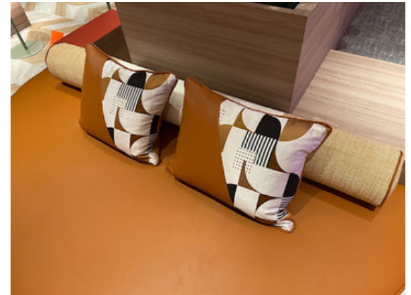
種別：円形ロングクッション×2 長方形クッション×8