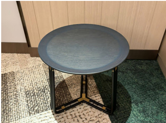
種別：ローテーブル(b) 個数：2（移動：可） 詳細：Φ450 x H450