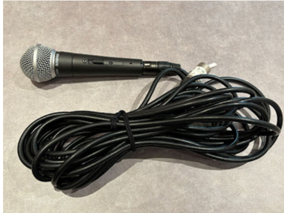
種別：有線マイク 個数：1