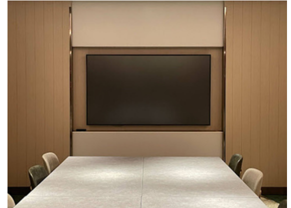
種別：モニター（75inch） 個数：1（壁掛けタイプ）