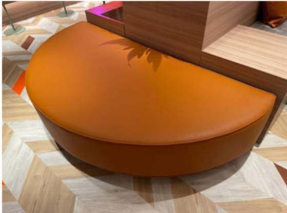
種別：半円ソファ 個数：2（移動：可、作業時は2人以上）