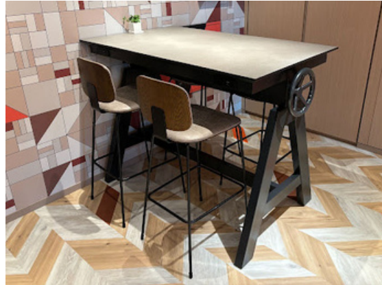
種別：テーブル(a) 個数：2（移動：可、作業時は4人以上） 詳細：W1,360 x D800 x H1,050