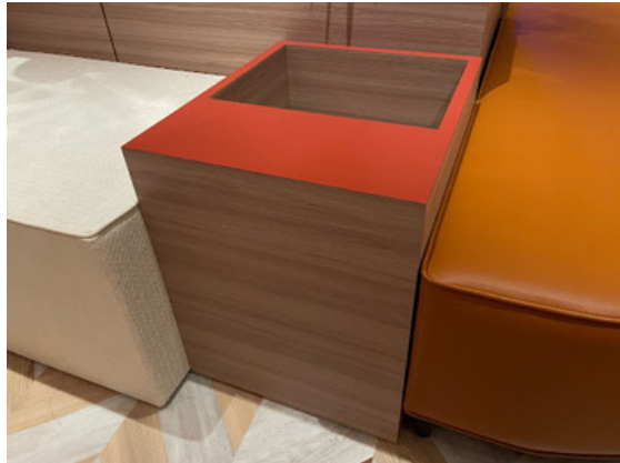
種別：ボックス 個数：4（各2つずつ）（移動：可）