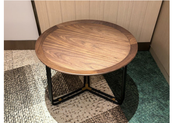
種別：ローテーブル(a) 個数：2（移動：可） 詳細：Φ600 x H450