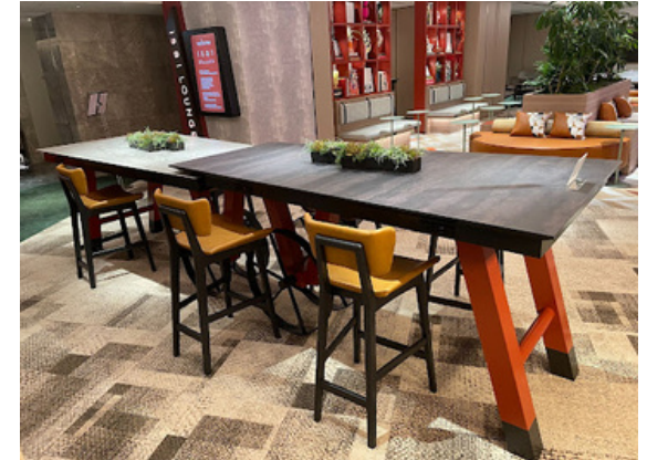
種別：テーブル(b) 個数：2（移動：可、作業時は3人以上） 詳細：(左)W2,150 x D1,080 x H960 (右)W2,150 x D1,080 x H1,010