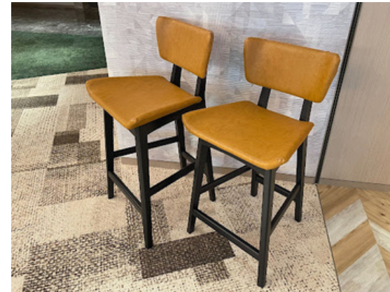
種別：チェア(a) 個数：6（各3ずつ） 詳細：(左)W420 x D380 x H900 (右)W420 x D380 x H950