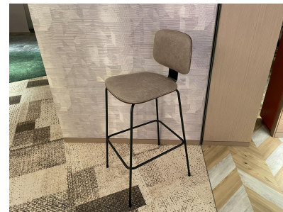
種別: チェア(b) 個数: 8 詳細: W370 \times D400 \times H1,000