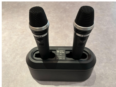
種別:無線マイク 個数:2 詳細:800MHz帯