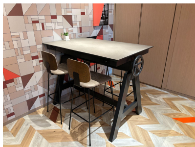
種別: テーブル(a) 個数: 2(移動:可、作業時は4人以上) 詳細: W1,360 \times D800 \times H1,050 ※移動時、壁面の配線を抜いてください