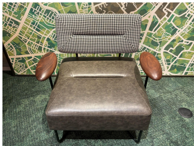
種別:ソファ(c) 個数:2(移動:可) 詳細:W580mm x D500mm x H700