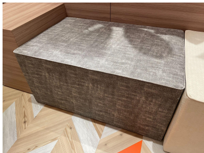
種別:長方形ソファ(a) 個数:2(移動:可、2人以上)