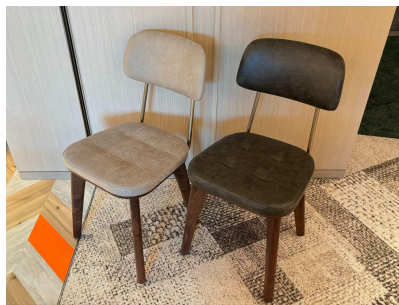
種別: チェア 個数: 12(白・グレー各6ずつ) 詳細: W410 x D390 x H800