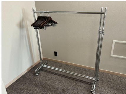
種別:ハンガーラック×2、ハンガー×40