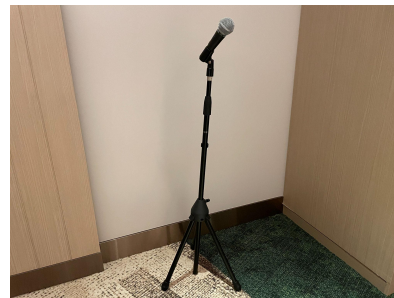
種別:マイクスタンド 個数:1