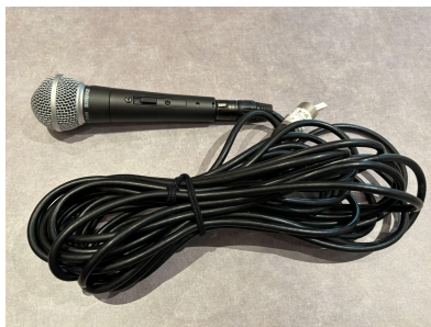
種別:有線マイク 個数:1