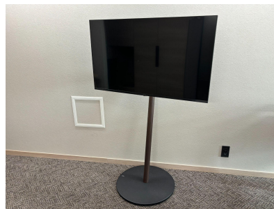
種別:モニター(43inch) 個数:1(移動:可)