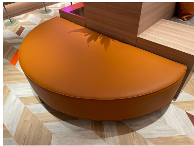
種別:半円ソファ 個数:2(移動:可、作業時は2人以上)