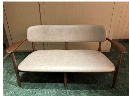
種別: ソファ(a) 個数: 2(移動: 可、作業時は2人以上) 詳細: W1250 x D580 x H760