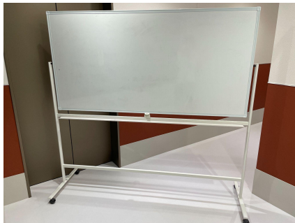
種別:ホワイトボード 詳細:(左)W1,800 × D900、(右)W1,200 × D900