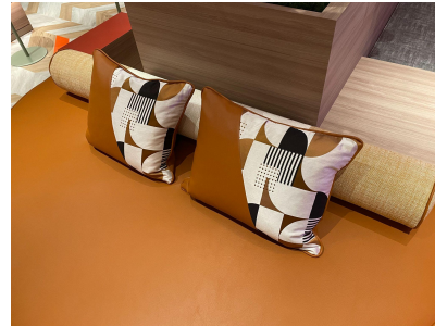
種別:円形ロングクッション×2 長方形クッション×8