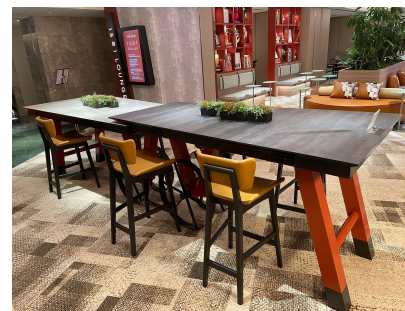
種別: テーブル(b) 個数: 2(移動:可、作業時は3人以上) 詳細: (左) W2,150 \times D1,080 \times H960 (右) W2,150 \times D1,080 \times H1,010 ※移動時、床面の配線を抜いてください