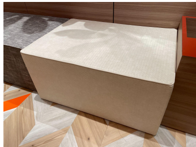
種別:長方形ソファ(b) 個数:2(移動:可、2人以上)