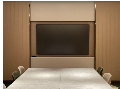
種別:モニター(75inch) 個数:1(壁掛けタイプ)