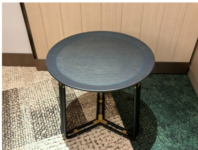
種別: ローテーブル(b) 個数: 2(移動: 可) 詳細: Φ450 x H450