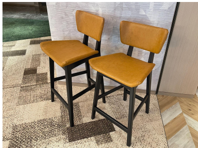
種別: チェア(a) 個数: 6(各3ずつ) 詳細: (左) W420 \times D380 \times H900 (右) W420 \times D380 \times H950