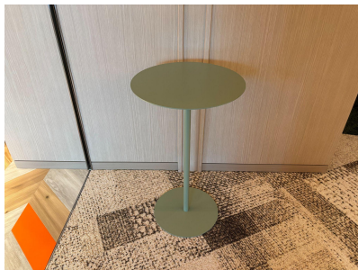
種別: 丸テーブル 個数: 17(移動:可) 詳細: \phi 380 \times H650