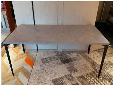
種別: 大テーブル 個数: 6(移動: 可、作業時は2人以上) 詳細: W1,600 x D800 x H710