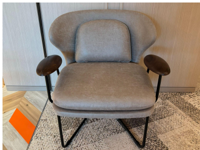
種別:ソファ(b) 個数:2(移動:可) 詳細:W580 x D500 x H730