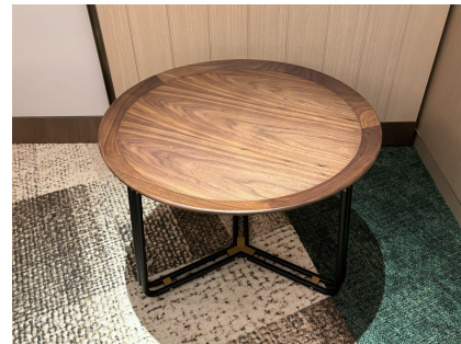
種別: ローテーブル(a) 個数: 2(移動: 可) 詳細: Φ600 x H450