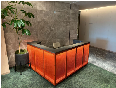
種別: 受付カウンター 個数: 1(移動:不可) 詳細: W1,730 \times D1,380 \times H900