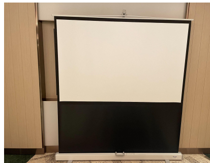
種別:プロジェクター・スクリーン 詳細:80inch 料金:¥3,000(税込¥3,300) / 1日