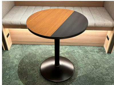
種別: 丸テーブル(a) 個数: 3(移動: 可) 詳細: Φ600 x H710