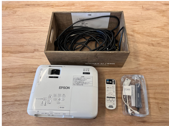
種別：プロジェクター 個数：1 詳細：EPSON EB-S04