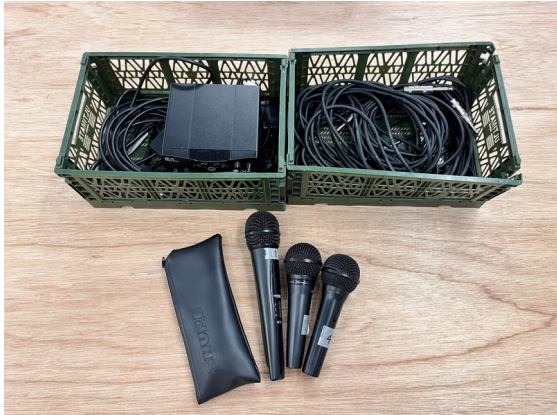
種別：マイク 個数：4 詳細：<要事前予約> ¥1,100 (税込) / 1回 無線x2 / 有線x2