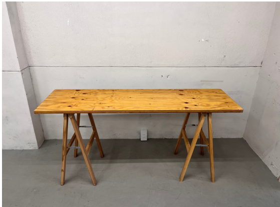
種別：テーブル（セパレートタイプ） 個数：6 詳細：W :1,500mm xD :445mm xH :700mm