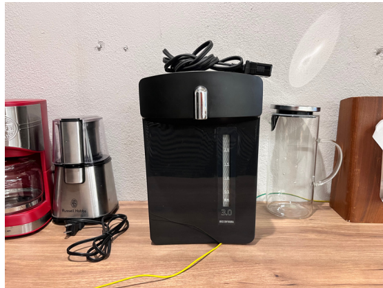
種別：電気ポット 個数：1 詳細：アイリスオーヤマ製