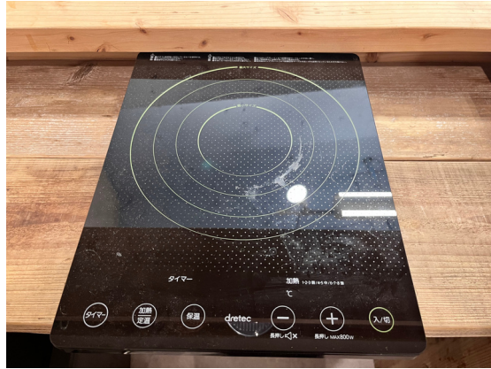
種別：IHヒーター 個数：1 詳細：D I-116