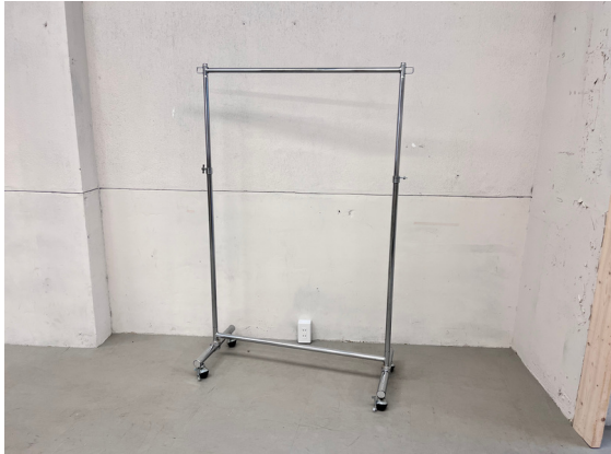
種別：ハンガーラック 個数：10 詳細：W900 x H900~1800(調整可)