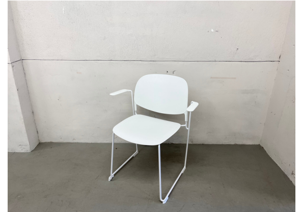
種別：チェア (C) 個数：2