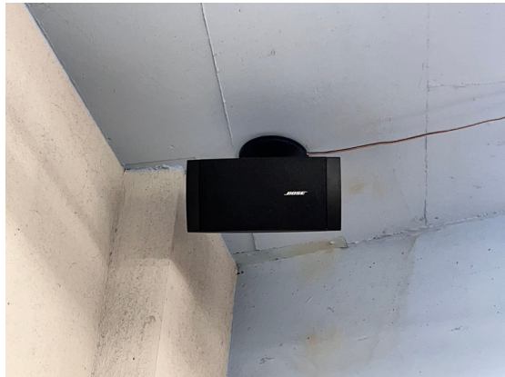
種別：スピーカー 個数：4 詳細：Bluetooth接続可