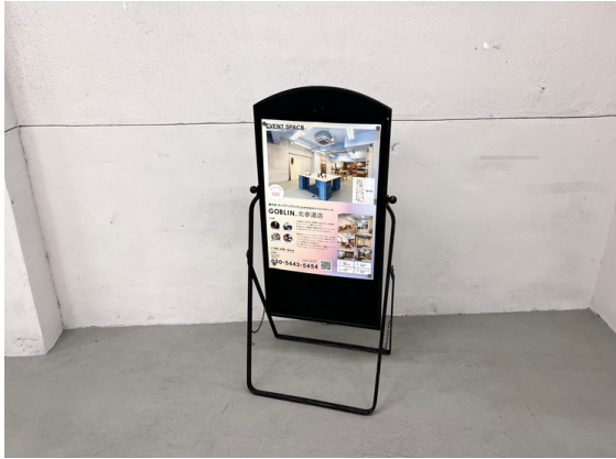
種別：アイアンボード 個数：1 詳細：【ボード面】W410 x D770