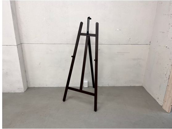
種別：イーゼル 個数：1