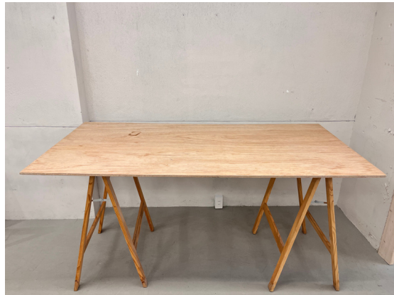
種別：合板天板 個数：2 詳細：W :1,800mm xD :800mm xH :700mm