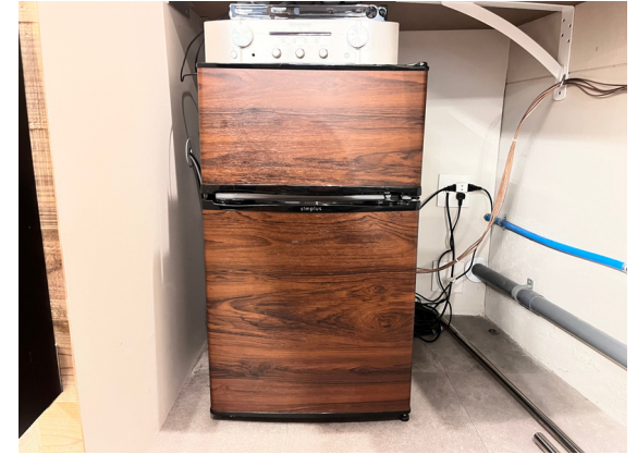
種別：冷蔵冷凍庫 個数：1 詳細：Haier JR-XP 1N4E-1