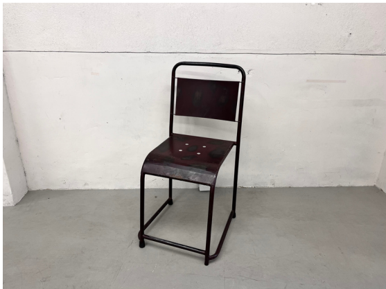
種別：チェア (D) 個数：1