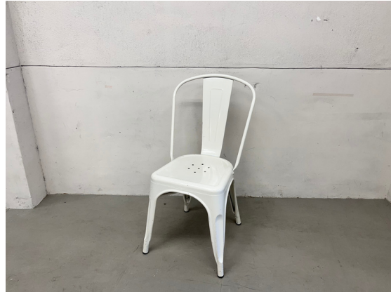
種別：チェア (B) 個数：2