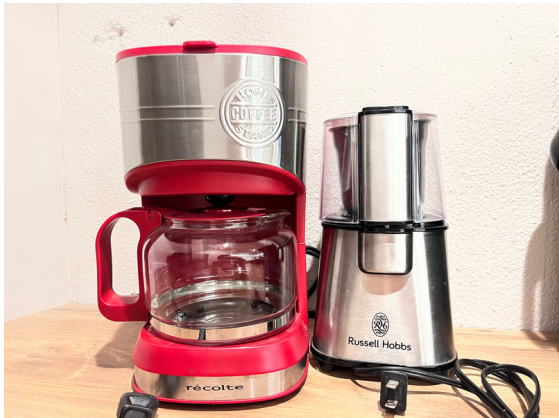
種別：コーヒーメーカー 個数：1