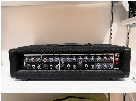
種別：マイクミキサー 個数：1 詳細：Class i cPro