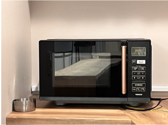
種別：電子レンジ 個数：1 詳細：YAMAZEN YRV-F230(B)