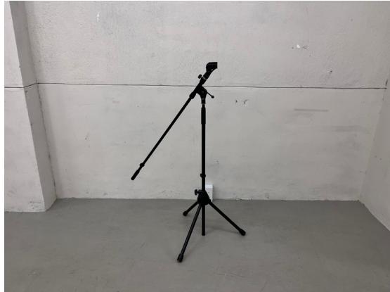
種別：マイクスタンド 個数：2 詳細：<要車前予約> ¥1,100 (税込) / 1回 ※マイクセットとして