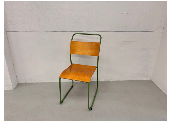
種別：チェア (F) 個数：1