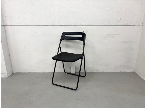
種別：折り畳みチェア 個数：16