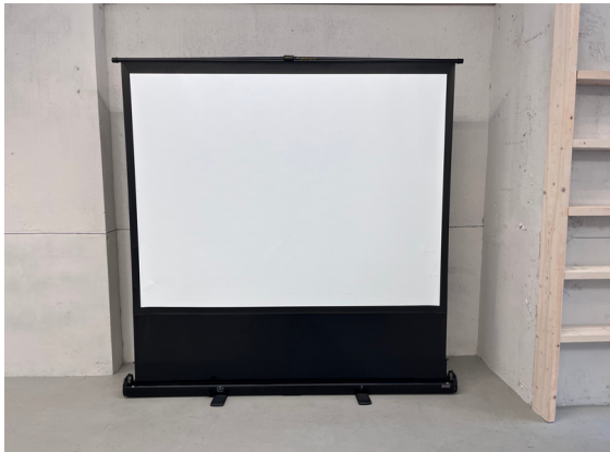
種別：スクリーン 個数：1 詳細：80 inch