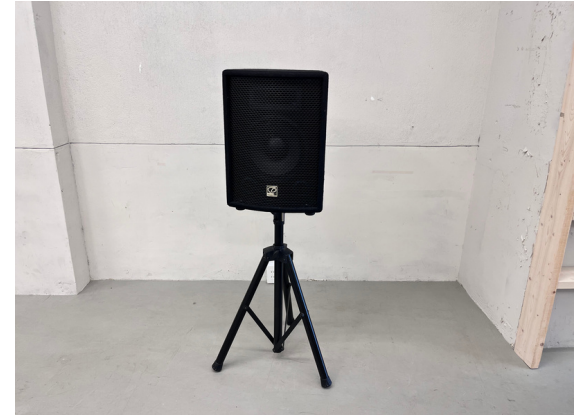
種別：スピーカー(マイク用) 個数：2 詳細：<要車前予約> ¥1,100 (税込) / 1回 ※マイクセットとして