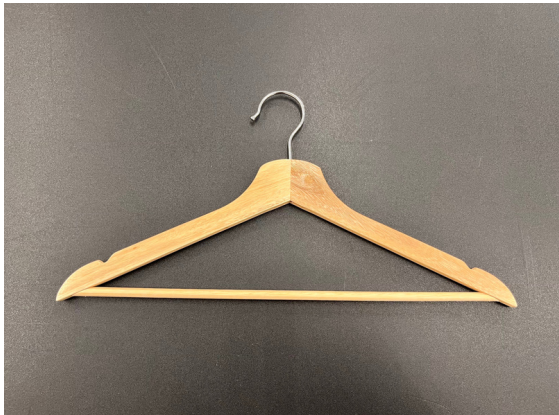
種別：シャツハンガー 個数：50