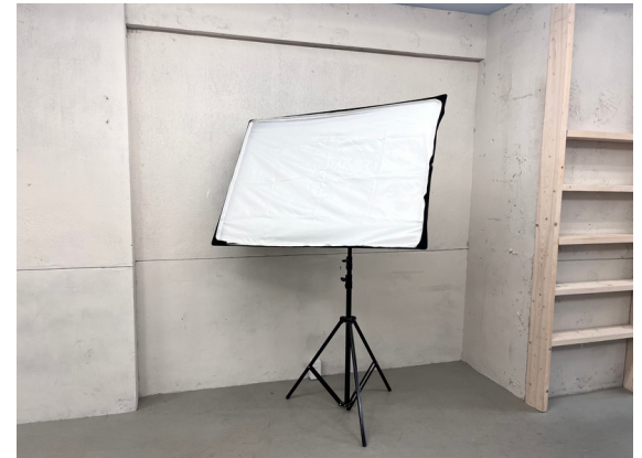
種別：ストロボ 個数：2 詳細：＜要車前予約＞ ¥2,200（税込） / 1回