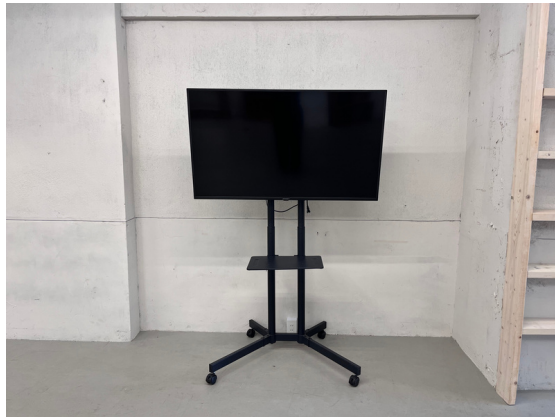
種別：モニター 個数：1 詳細：50 inch