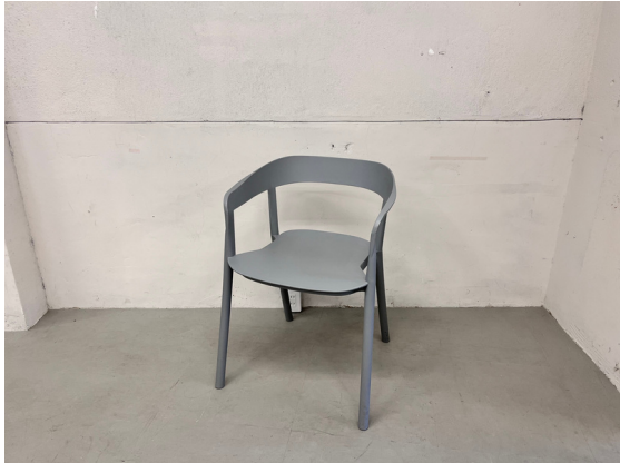
種別：チェア (A) 個数：2