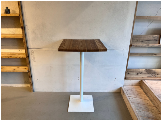
種別：ハイテーブル 個数：1 詳細：W :6 00mm xD :6 00mm xH :1 ,050mm