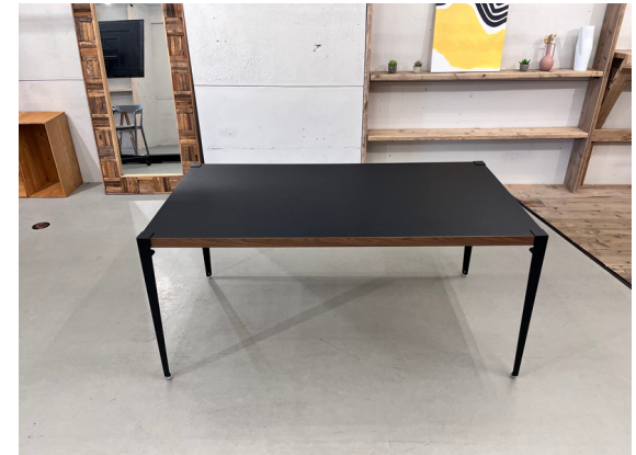
種別：テーブル 個数：3 詳細：W :1,820mm x D:910mm