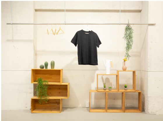
種別：吊りラック 個数：5 詳細：【要事前予約】1箇所につき：¥1,100(税込)