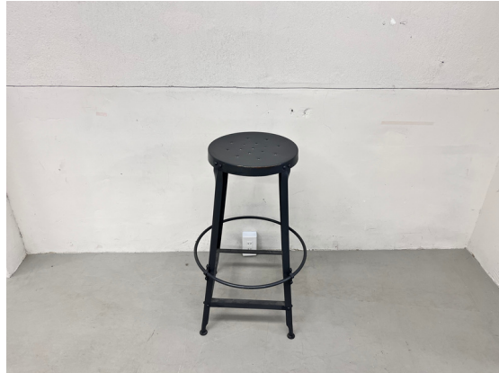
種別：ハイスツール 個数：2