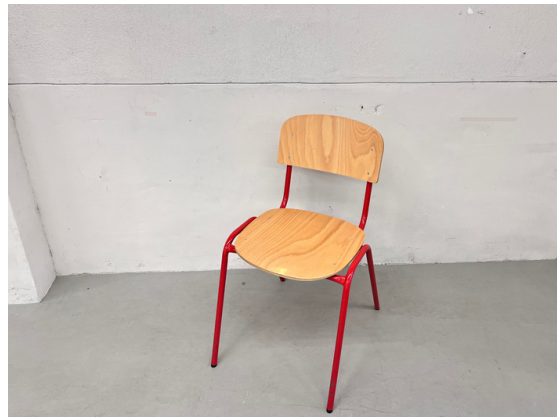
種別：チェア (E) 個数：4