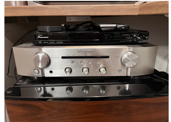
種別：オーディオ 個数：1 詳細：marantz PM5005