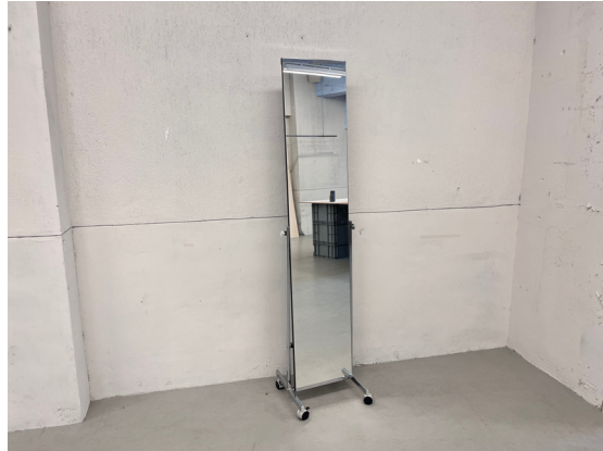
種別：姿見 個数：2 詳細：W1500 x H3000