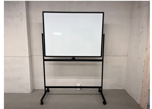
種別：ホワイトボード 個数：1 詳細：【ボード面】タテ：900mmx ヨコ：1.200mm 高さ：1800mm