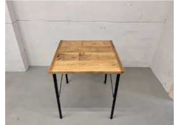
種別：スクエアテーブル 個数：2 詳細：W700 x D700 x H725