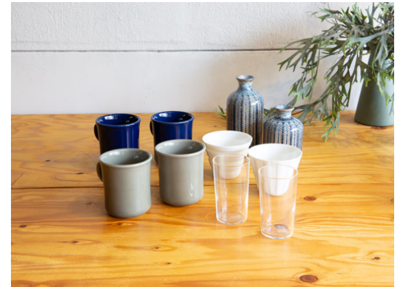
種別：コップ類 個数：複数