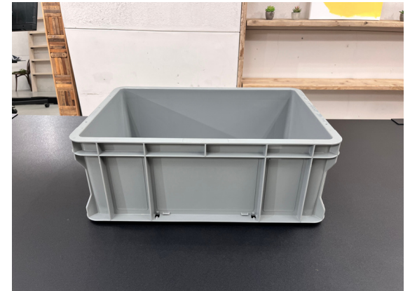
種別：コンテナ 個数：15