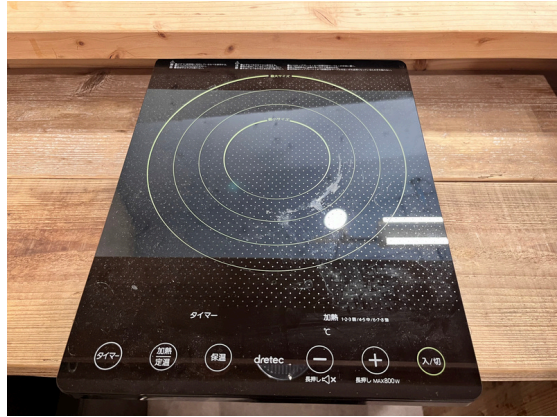
種別：IHヒーター 個数：1 詳細：D I-116