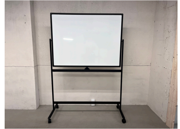
種別：ホワイトボード 個数：1 詳細：【ボード面】 タテ：900mmx ヨコ：1.200mm 高さ：1800mm