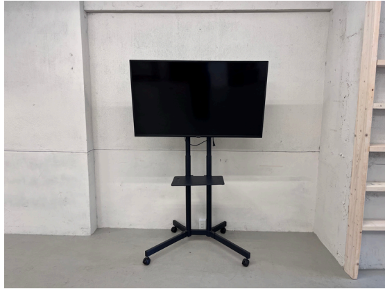
種別：モニター 個数：1 詳細：50 i nch