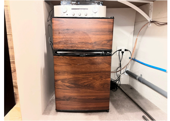
種別：冷蔵冷凍庫 個数：1 詳細：Haier JR-XP 1N4E-1