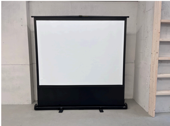
種別：スクリーン 個数：1 詳細：80 i nch