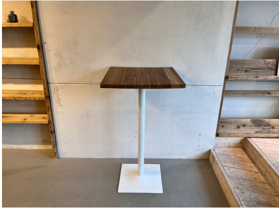
種別：ハイテーブル 個数：1 詳細：W :6 00mm xD :6 00mm xH :1 ,050mm