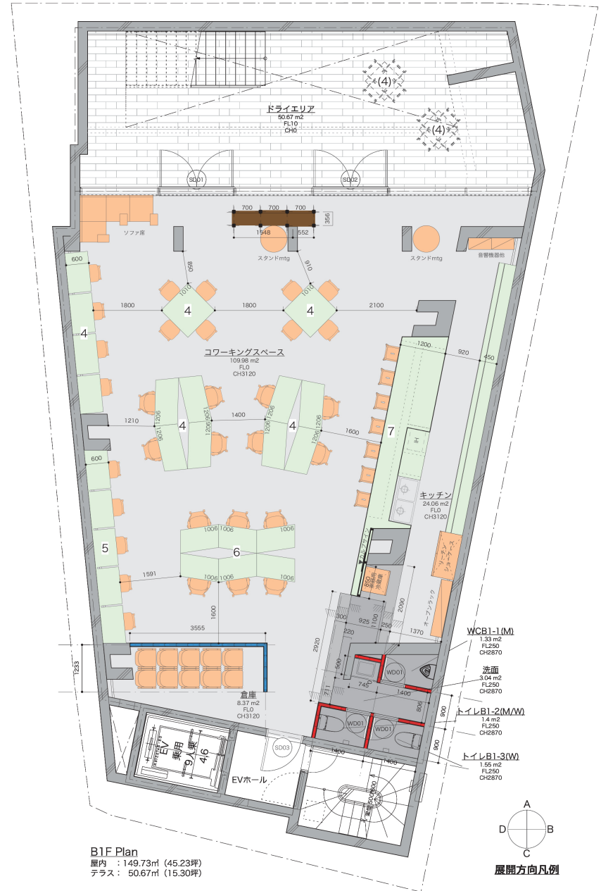
B1F Plan 屋内：149.73m 2 (45.23坪) テラス：50.67m 2 (15.30坪)